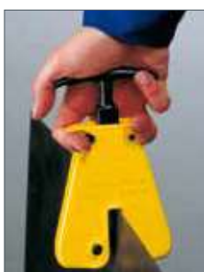
Auf- und Absetzen