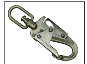
IKV 33 (ANSI Z.359.1-2007; CSA Z259.12-2011) mit Fallanzeiger