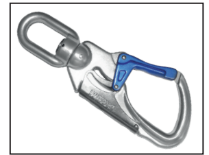
IKV 21 (EN 362:2004-T) mit Fallanzeiger